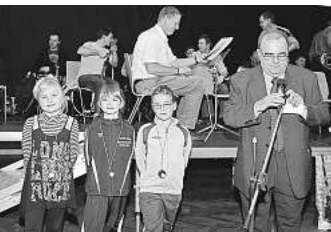
Les jeunes majorettes sélectionnées pour le championnat de France ont été récompensées.