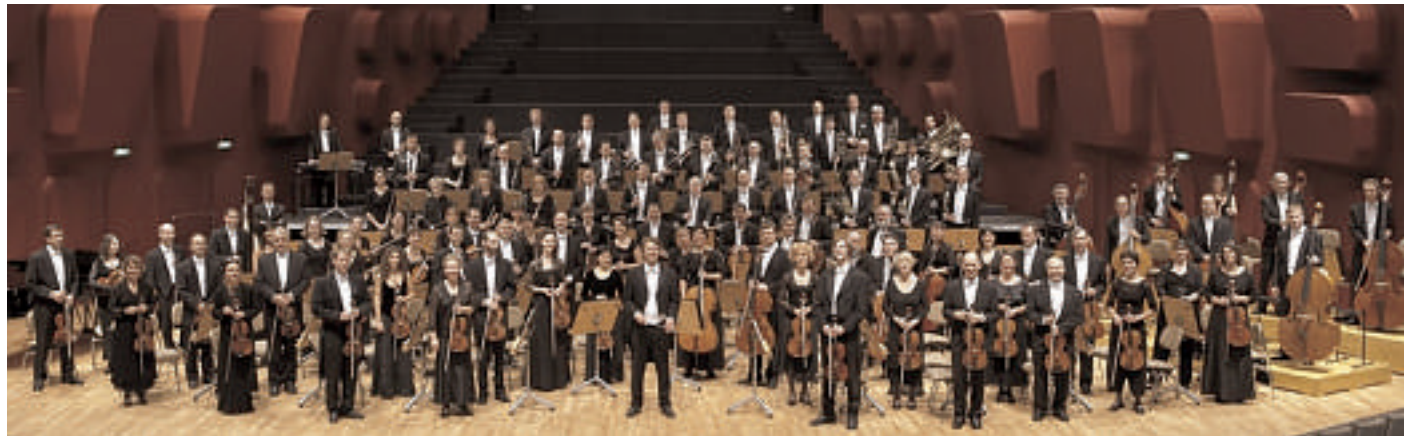
L'orchestre philharmonique de Strasbourg sera samedi à l'église Saint-Anould de Plaine.

Les mélomanes de la vallée de la Bruche sont comblés en ce début de l'an 2010 : l'orchestre philharmonique de Strasbourg fera escale à Plaine, ce samedi 9 janvier.